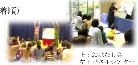
上：おはなし会 左：パネルシアター

発行 (公財)川崎市生涯学習財団 〒211-0064 川崎市中原区今井南町514-1 川崎市生涯学習プラザ内 ☎:044-733-5560 FAX:044-739-0085 URL: http://www.kpal.or.jp Eメール:stage-up@kpal.or.jp