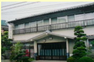
「大溝太々講」御師宅『大木荘』

大山街道沿いの各村落では、夏山シーズンに要所要所に木の燈籠を立て毎晩欠かさず火を灯しました。大山燈籠は、総絵製の高さ・幅・奥行きそれぞれ75cm位の燈籠を4寸角、高さ6尺の柱にのせたものです。昭和24年ごろ一旦廃止され、昭和55年から二子だけは復活し、毎年「高津区民祭」の行事に合わせて二子神社の前に立てられるようになりました。