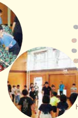
ドッジボール交流