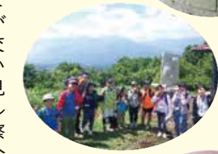
鼻戸屋ハイキング