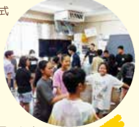
向丘小クラスレク