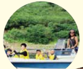
田沢湖ボート体験

地域の方々の協力により多彩な体験活動が行われています。中心となって支えてくださっているのが、花巻市東和町まちおら交流推進協議会の皆さんです。野菜収穫体験では畑での収穫だけでなく、出荷や選別作業も見学しました。収穫した野菜を使ったピザづくりやおやつ作り、昔遊びの工作なども、地域の方に教わりながら楽しく体験。人とのふれあいを通して、心に残る思い出が生まれました。