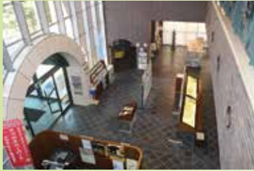
▲ 1階 展示コーナー

川崎市公文書館は、市民の生活の向上及び文化の発展に資するため、歴史的文化的価値のある公文書及び資料類を適正に保存し、かつ、有効に活用するとともに、市民生活の場に関する情報を中心とした統合的な情報公開を推進することを目的として、1984(S59)年10月1日に開設しました。