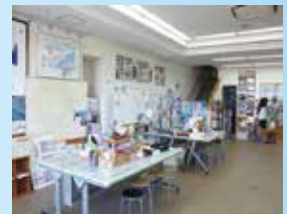
▲ 1階 河川情報室

1階の河川情報室の展示物は、ボランティアスタッフによる解説があります。2階には会議室があります。