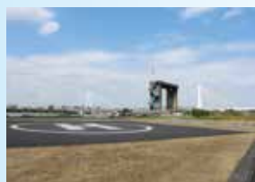
▲ 高規格堤防とヘリポート