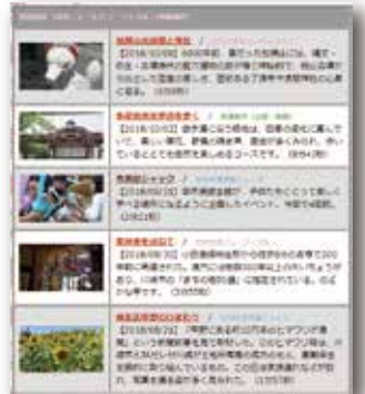
▲ かわさき市民ニュース

市民の手で、市民の目線で、川崎の「今」を動画で記録しており、川崎のニュースと美しいシーンを配信し、後世へ残すために「蓄積」をしています。