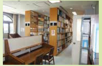
▲ 市政資料閲覧室(2階)

の広がり～」企画展示では、「あなたに伝えたい記録と記憶—公文書館所蔵資料から—」第6回川崎市内における戦時下の訓練を展示しています。