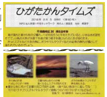
▲ ひがたかんタイムズ

ひがたかんタイムズは、2008(H20)年11月15日に創刊号を発行しました。創刊号当時には「ひがたのゆかいな仲間たち」をシリーズで掲載していました。2018(H30)年12月で62号(現在、偶数月に発行)を迎えたひがたかんタイムズには、干潟歳時記がシリーズで掲載されています。多摩川の干潟に住む幼魚やカニの仲間や鳥たちの様子が手に取るように分かる解説をしています。また、同会の主催するイベントのお知らせなどを掲載しています。