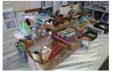
▲ エコクラフトの材料

テーブルの上にはどんぐり、まつぼっくり、クルミ、小枝などの自然素材や、トイレトーパーの芯、ペットボトルキャップなどがあり、来館者が自由にエコクラフトで楽しむことができます。