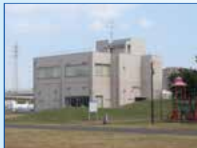
▲ 大師河原水防センター

大師河原水防センター(大師河原干潟館)は、2007(H19)年12月に建設されました。建設前に、都市再生機構の土地有効利用事業(国)と市の共同事業により、河川防災ステーションの整備と一緒に、2002(H14)～2006(H18)年度に高規格堤防の整備を行いました。多摩川の洪水(災害)時の防災活動や自然環境、地域の歴史・文化などについて、情報発信・環境学習を行う市民活動の拠点となっています。ヘリポートも整備されています。