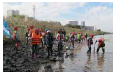
▲ 近隣の小学校 秋の干潟観察会

学校や幼稚園・PTAなどから観察会や講習会への依頼が月に20件以上になることもあります。会員の日程を調整しながら、できるだけ要望に応えるようにしています。一日体験を希望する団体もあり、潮見表カレンダーを参考にしながら、自然条件や天候の変化にも応じることのできる計画をたてています。