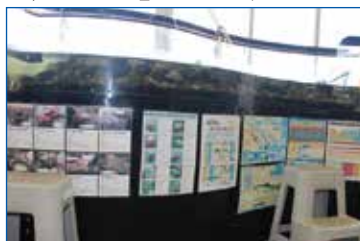
▲ 河口に住む生き物たち

1階の河川情報室にある水槽には、多摩川の河口に住む生き物たちを飼っていて、いつでも観察できるように分かりやすい説明で表示しています。