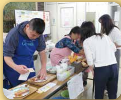
▲おかし工房「しいの実」の販売

・同じ位の歳の子どもたちと遊ぶ機会が、なかなかないので、娘がとても楽しそうなので助かっています。 ・親同士、子どものいろいろな話ができるのがありがたいです。