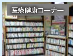
医療健康コーナー