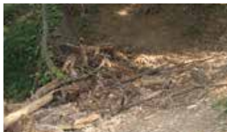
▲ クワガタ等の巣となる木

健康の森の掲示板を利用したりしています。「トイレの設置」「電気を通すこと」「会員を増やすこと」等が課題だと話します。