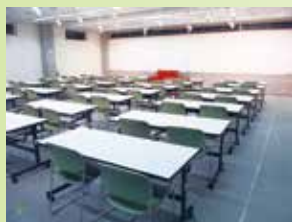
▲ 多目的で利用可能なイベントホール