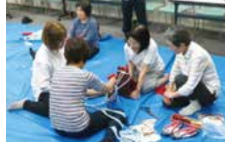
▲ 里山研修(ぞうり作り)

5月27日(日)布ぞうり作り(井田病院内会議室)と6月3日(日)、池の手入れをしました。水漏れの場所の泥を除去してからサイドに鋼板を埋め込みアンカーにて留めました。