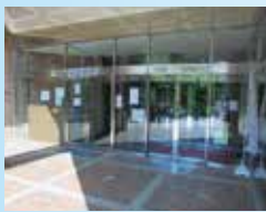
▲ 市民館・図書館入口

1985(S60)年7月、麻生市民館との複合施設(麻生文化センター)としてオープンしました。麻生文化センターの1階・2階部分にあります。