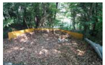
▲ 落ち葉かきのプール

また「落ち葉かき」には近隣の親子たちが大勢参加し、集めた落ち葉を仮設のプールに運び、プールが満杯になるとプールに飛び込む、大人気のイベントです。育てる会の会員が豚汁等をふるまっておもてなしをしています。