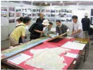
▲ 創立50周年の展示会&イベント

稲田郷土史会(以降「同会」と略します)は1967(S42)年4月に創立し、昨年、50周年を迎えました。川崎市内有数の郷土史研究団体として多摩区を中心に活動しています。