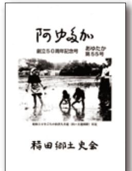
▲ あゆたか創立50周年記念号

同会では、毎年機関誌「あゆたか」を刊行しています。昨年、創立50周年記念号(55号)を刊行しました。表紙には昭和30年代の何処でもよく見られた「田植え」の写真(両親が見守る中、手つき良く苗を植える兄弟)が掲載されています。