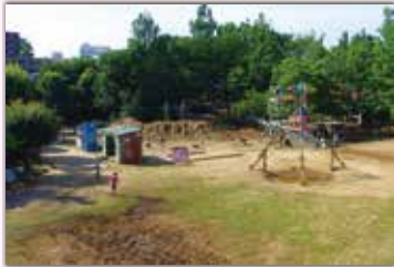
▲ プレーパークで思いきり遊べます

「川崎市子どもの権利に関する条例」を基に、その具現化を目指してつくられた川崎市子ども夢パーク。