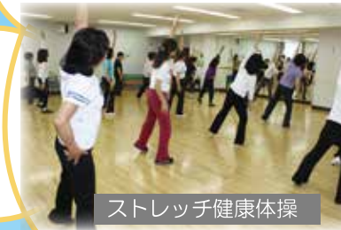
ストレッチ健康体操

気功太極拳 小机先生 太極拳の健康効果を自らの健康づくりと重ね合わせて、楽しみながら取り組んでいる姿に元気づけられます。