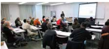
▲ 多摩区郷土史入門講座

同会は市内外をめぐる「史跡見学会」をはじめ、多摩図書館と協力しながら、「多摩区郷土史入門講座」「ふるさとなんでも相談」等を毎年行っています。「多摩区郷土史入門講座」では、毎年さまざまなテーマで郷土の歴史を市民に紹介しています。