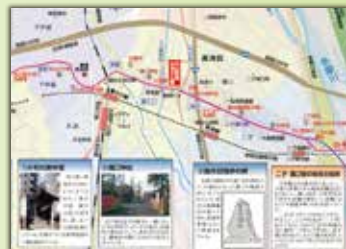
▲ 写真とイラストのガイドブック

価格:1,100円(税込) 購入方法:大山街道ふるさと館の他、当財団などでも販売しています。