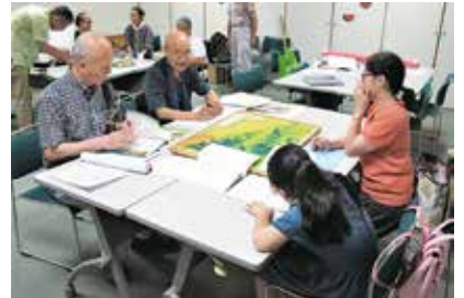
▲ 自由研究の相談を受ける同会のみなさん

毎年、8月上旬に多摩図書館と共催で行われている「ふるさとなんでも相談」では、同会のメンバーが対応しています。ちょうど子どもたちは夏休み期間中なので、自由研究のテーマとして「地域の歴史や文化」について調べることが多く、相談に対応しています。同会のメンバーが、調べる観点や資料の扱い方等を適切に助言したおかげで、昨年相談に来た児童の作品が川崎市立小学校社会科作品展で参考作品として選ばれました。