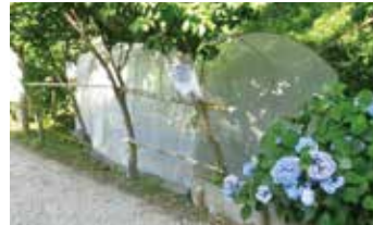
▲ ホタル観賞用のネット小屋

ています。井田山は、清水が湧くためホタルの餌になるカワニナがよく育つので、毎年6月に「ホタル観賞会」を開催しています。5月24日、ホタル小屋(観賞用のネットの中にホタル