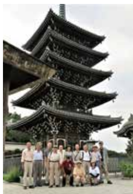
▲ 史跡見学会(香林寺五重塔)