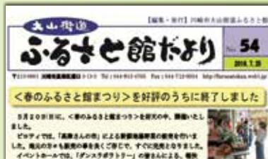
▲ ふるさと館だより(奇数月発行)

奇数月発行されている「ふるさと館だより」は、講座の報告やこれからの事業などの案内が掲載されており、ホームページでも閲覧可能になっています。