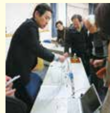
▲カテーテルの紹介

日本医科大学武蔵小杉病院の協力による講座「からだに優しい治療が血管内・低侵襲治療です」では、カテーテル(医療用に用いられる中空の柔らかい管のこと)を持参しての説明がありました。