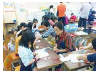
▲ 橘小学校ふれあい祭り

昨年10月、地域の「橘小学校ふれあい祭り」に参加協力し、開場早々、ぶんぶんゴマは満席、その待ち時間に風車も満席、昼食時は廊下に列ができるほどで、昼休みも大盛況でした。