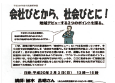
▲ 市民講師@すくらむ21のチラシ