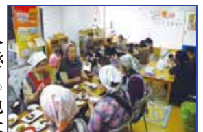
▲ クッキングおふくろ

◆クッキングおふくろ 川崎市地域女性連絡協議会の協力で、日本の伝統料理を作ります。若いお母さんに好評です。2月下旬開催(ひな祭り料理を作る)予定です。