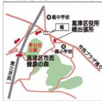
▲ 健康の森の所在地

高津区市民健康の森は、第三京浜と市民プラザ通りが交差する南東側に位置しており、ホテルの里(たちばなふれあいの森:森地区)と春日台公園(丘地区)からなりたっています。対象地はその地形の形状から「森」と「丘」に分けられ、「丘」の部分は都市公園「春日台公園」として、2007(H19)年に一般開放されました。