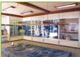
▲ 伝統工芸館の内部

工芸館では初心者の方も事前準備なしで気軽に楽しめるハンカチ染めの体験と、お好きな布を持ちこんで染められる持ち込み染色ができます。