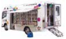
▲ たちばな号 ▼ 車内

宮前文化センター内にある宮前図書館は2週間に一度、図書館から離れている方のために市内21ヶ所のポイントを巡回する移動図書館「たちばな号」の拠点