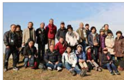
▲ サークルの仲間と

「オープンマインドであれば、色々な人を受け入れることができ、様々な良い出会いはオープンマインド