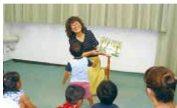
▲ 未就学児のおはなしひろば

によりやく言葉を遣い始める2歳児は初めて出会う言葉が多いので、季節を取入れ、実物を見せたりしながら絵本の楽しさを伝えています。未就学児への読み聞かせは、時々子どもの反応に合わせてコミュニケーションをとりながら楽しそうに進