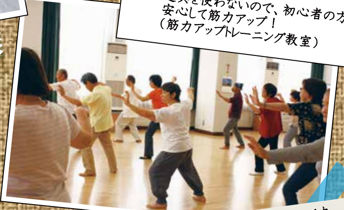
年齢を問わず、誰でも、どこでも、いつでもできるのが魅力です。 (気功太極拳教室)