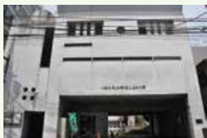
▲大山街道ふるさと館