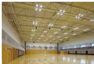
▲大体育室:観覧席は可動式も含めて1,554席。仮設ステージにも対応