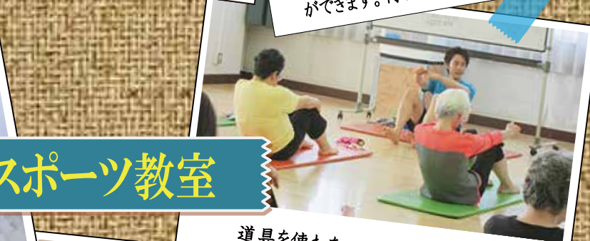
道具を使わないので、初心者の方でも 安心して筋力アップ！ (筋力アップトレーニング教室)