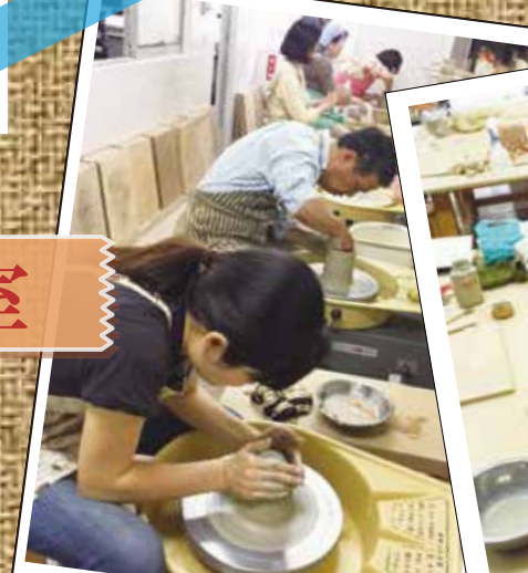
電動ろくろは全部で11台