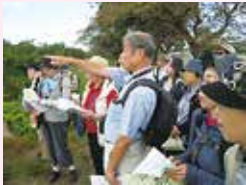
▲ 街道学習講座(街道歩き)

10/26(木) 愛甲石田～石倉橋 11/ 9(木) 伊勢原～良弁瀧 11/16(木) 伊勢原～阿夫利神社下社