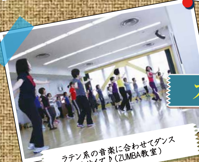
ラテン系の音楽に合わせてダンス エクササイズ♪(ZUMBA教室)