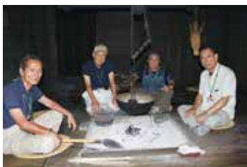
▲ 囲炉裏で談笑する会員のみなさん