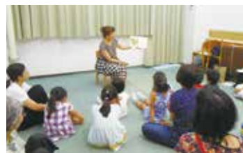
▲5歳以上のおはなしひろば

保護者からは、「子どもが「家庭でも読書好きになった」「音読が得意になった」、保護者も「地域社会と関わるきっかけとなった」等の感謝の声もあります。同会の活動を通して、伝える人の温かみは年齢を超えて影響を与えています。