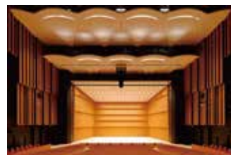
▲ホール:舞台が額縁のように見えるプロセニアム式。2,013席を有する市内最大のホール