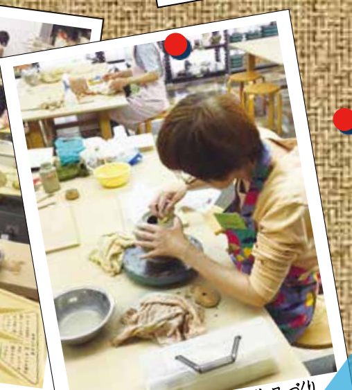
手びねりは自由な発想で作品づくり ができます。何ができるかな？