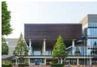
▲施設前:季節の移り変りを楽しめる銀杏の木

2017(H29)年10月1日、川崎区富士見にある富士見公園の一角(川崎市体育館跡地)に体育館とホールを備えた新しい複合施設、「川崎市スポーツ・文化総合センター」(愛称カルッツかわさき)が誕生しました。(スポーツ施設、共用施設、文化施設 地下1階 地上4階) 同じ敷地内にスポーツ、音楽コンサート、演劇をはじめ、レクリエーション、コンベンション(会議や研修、講演会、展示会、施設全体を利用したイベント等)、多様な市民の活動に対応でき、「まちと市民」「スポーツと文化芸術」「地域間」の繋がりを大切にする施設です。