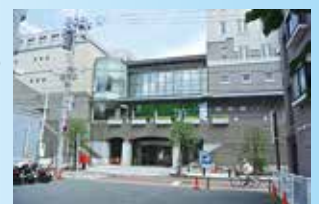
▲ 多摩区総合庁舎外観