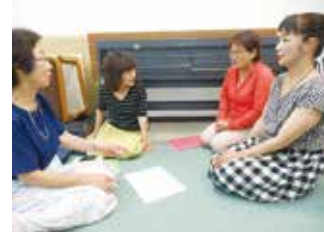
▲活動後の振り返り

メンバーによる月一回の定例会では、活動のための綿密な準備がされています。他にも勉強会や講座等を行い、受講者が会員として参加する等、学びが実践に活かされ、地域貢献へと繋がっています。