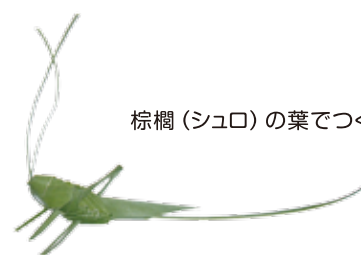
棕櫚(シュロ)の葉でつくる草バツタ▶