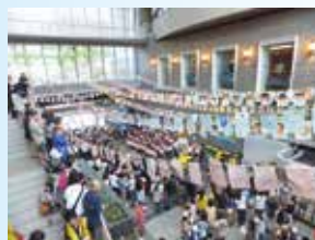
▲ たまたま子育てまつり