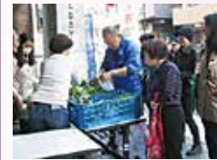
▲ 秋のふるさと館サポーターズクラブまつり

内容:ふるさと館利用団体による作品展示 (絵画・俳句・短歌・絵たより・生け花・習字等)