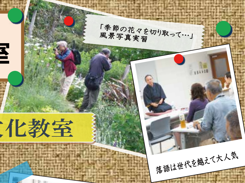
「季節の花々を切り取って…」 風景写真実習