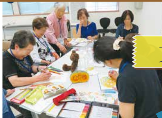
「色えんぴつ」先生の手は魔法の手