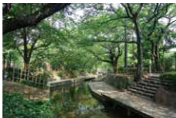
▲ 3 緑化センター