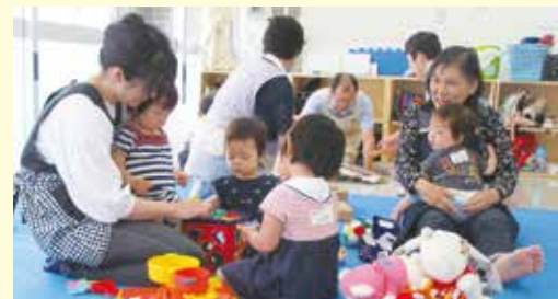
←お子さん同士と一緒に遊びだすことも。多様な人と接する機会になっています。

当財団でもスポーツ教室を開催して、保護者の方の学び・健康維持を支援しています。講座の開始直後は不安な顔だったお子さんも、おもちゃ遊びや本を読んでもらうと笑顔に。お子さんを迎えに来る、保護者の方の嬉しそうなお顔が見られるのも、励みになります。