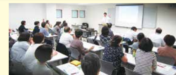
↑特別支援に必要な知識を身につける、養成講座。ベテラン講師の話が参考になります。

みなさんの経験を子どもたちの未来のために役立ててみませんか。あなたの生きがいにもつながる、充実したボランティア体験がきっと待っています。