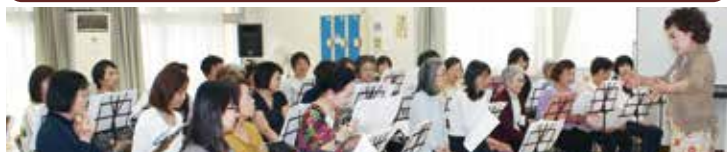
▲ ☆キラリ文化教室「楽しく歌の教室」