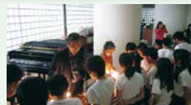
↑手回し発電機で、豆電球を光らせるのは、かなり大変そうでした。