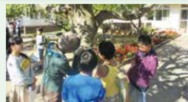
↑幹の太さと葉の面積からCO 2 の吸収量が計算できるそうです。