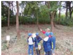
▲小学生の環境学習

森人の会では、区内の学校、支援施設との連携を深め、野外活動や体験学習を行ってきました。10年前から区内の小学校2校が環境を学ぶ5年生全員の学習に訪れています。また、緑地が学区内に位置す