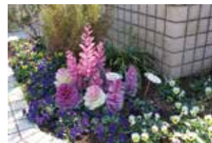
▲近所の人気スポットの三角花壇

特別養護老人ホーム「多摩川の里」から依頼を受けて、2007(H19)年5月から、エントランス、庭、ベランダ等のガーデニングに携わっています。「歩道横の三角花壇」は、近所の方たちの楽しみな人気スポットになっています。