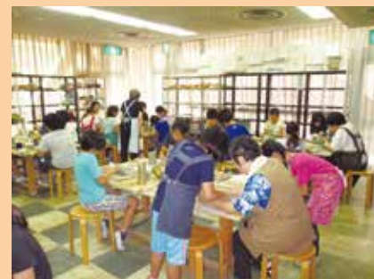
▲子ども陶芸教室の様子