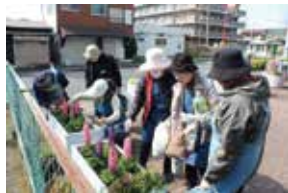
▲花ガラ摘みや水やり

れ始めたツツジなどの植込みをガーデニング好きの住民が花壇として再生したことです。その後、夏の水やりや、花苗購入時の運転、その他さまざまな活動にマンション居住者が 助っ人 として多数参加し、特に夏場の期間(梅雨から秋の彼岸まで)は、毎日早朝、50人体制(5人1グループ10組)で予定表にそって水やりをしています。ひと段落した頃、参加した方々へ招待状を出し、料理を持ち寄り、「花たちからの ありがとう パーティー」の慰労会を行い、花談議で、さらに花を咲かせています。