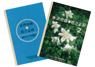
▲水沢の森 花ごよみ

る稗原小学校では、児童・教員・保護者が農作業に参加し、植え付けから収穫までの畑の仕事を体験する場として活用しています。緑地の管理作業には複数の支援施設利用者が参加しています。竹林整備のためのタケノコ掘や栗拾い、柿もぎ等では市民参加イベントとして近隣の自治会や子ども文化センター等に開放しています。他にも、バードウォッチング、夜の自然観察会、一般区民を対象としたガイドツアー等も定例行事となっています。広々とした草原は稀少な存在で、バッタやトンボを取る子どもたちに好評で、秋には美しいススキ原となり、人気スポットとなっています。