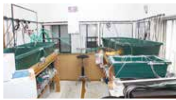
▲ホタルの幼虫とタニシの水槽

のために、心を込めて11ヶ月間ホタルを育てています。水槽のきれいな水を保つために、近所の方から井戸水の提供を受けています。その井戸水を部屋の2階まで運ぶのは、とても重労働です。さらに、夏場の温度管理には充分配慮しています。