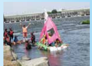
▲ エコ★カップいかだ下り

「多摩川桜のコンサート」「多摩川夕涼みコンサート」「河童の川流れ」「エコ★カップいかだ下り」「秋の収穫祭」等、大人も子ども一緒になって楽しい一日を過ごすことができる企画ばかりです。