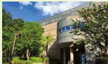
▲ 麻生スポーツセンター