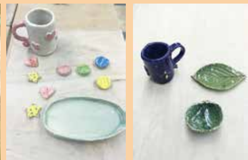
▲子どもたちの作品