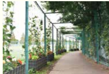
▲みどりが登るスクリーン