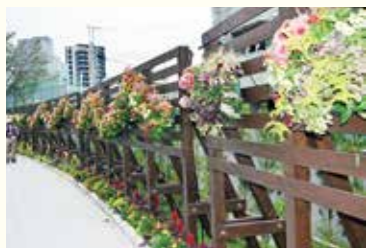
▲ハンギングバスケット