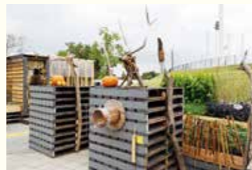
▲メインガーデン ACTIVE GARDEN