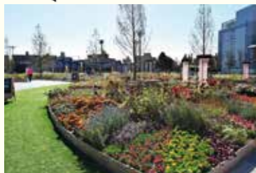
▲メインガーデン Colors, Future Garden