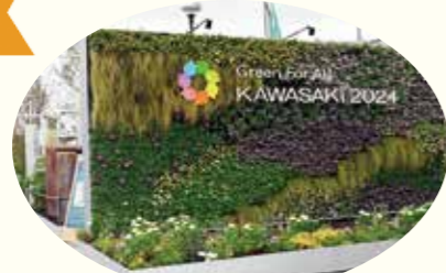
▲おもてなしのフラワーゲート

全国都市緑化かわさきフェアを統括・代表する富士見公園会場は、次の 100 年に向けて、川崎が目指す「みどりのまちづくり」を実現する技術や考え方を紹介する展示がされていました。