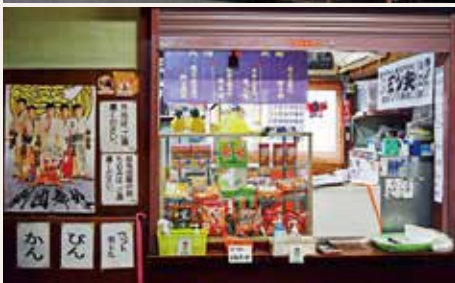
上) 外観 下) 劇場内の売店

収容の畳敷きの客席に、懐かしさに胸がいっぱいになるような売店など、まるで昭和から抜け出してきたような風情が魅力的です。