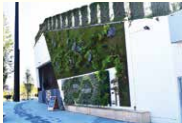
▲垂直花壇 Vertical GARDENS