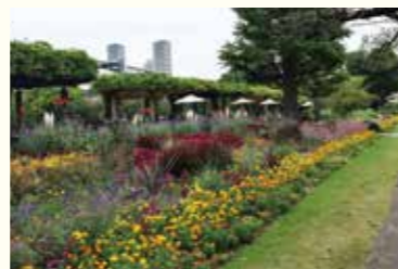
▲ロングボーダーガーデン