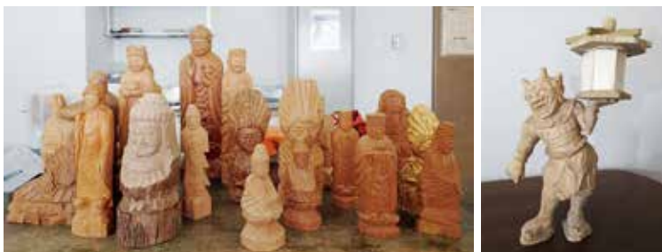
◀円空仏以外の作品も