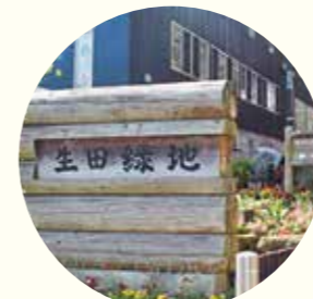
▲竹のエントランスゲート

生田緑地の自然美がベースの緑豊かな会場で、心身共にリフレッシュ。木漏れ日を浴び、清浄な空気に浸りながら、歴史・文化・アートを堪能しました。生田緑地の竹を使ったエントランスゲート、緑地内の間伐材の薪(まき)を子どもたちと一本一本丁寧に染めて作り上げたランドアートなど、生田緑地ならではの展示のナチュラルな雰囲気が印象に残りました。パーソナルモビリティ(1人乗りの乗り物)の貸し出しもあり、広い敷地ですが、どなたでも楽しめるような配慮がされていました。